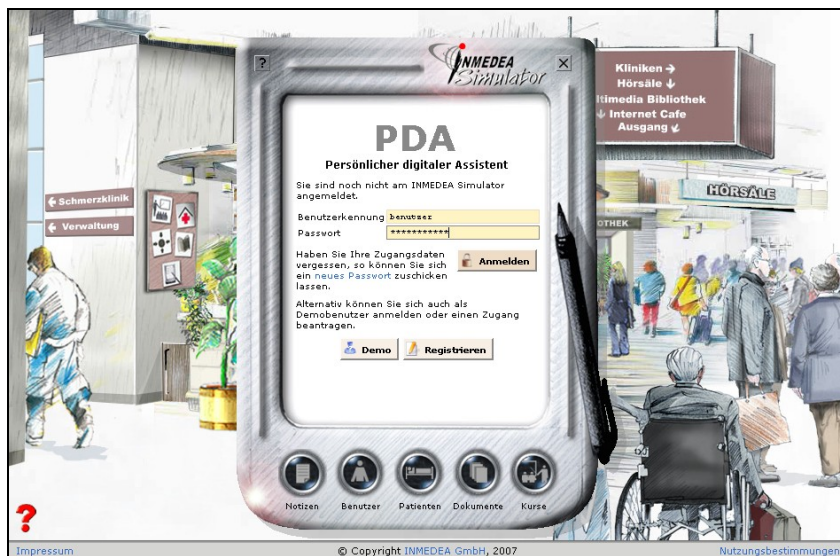
Abbildung 5: PDA